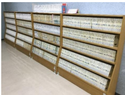
創刊から揃えている「岩波新書」、 「講談社現代新書」等