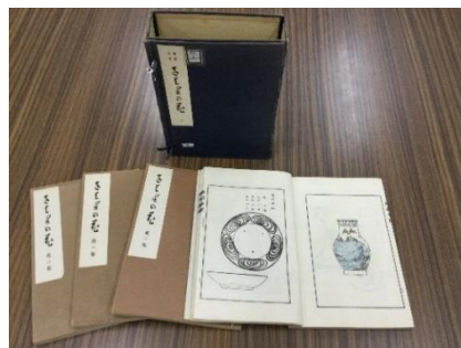
『をはりの花 (陶器全集)』1932年刊行

本館の存在意義は、先人から受け継ぐ確かな知識、知の蓄積があること。図書館の開館は、終戦の年1945年、現図書館は1970年の竣工で、その当時に入手した資料を保存している。